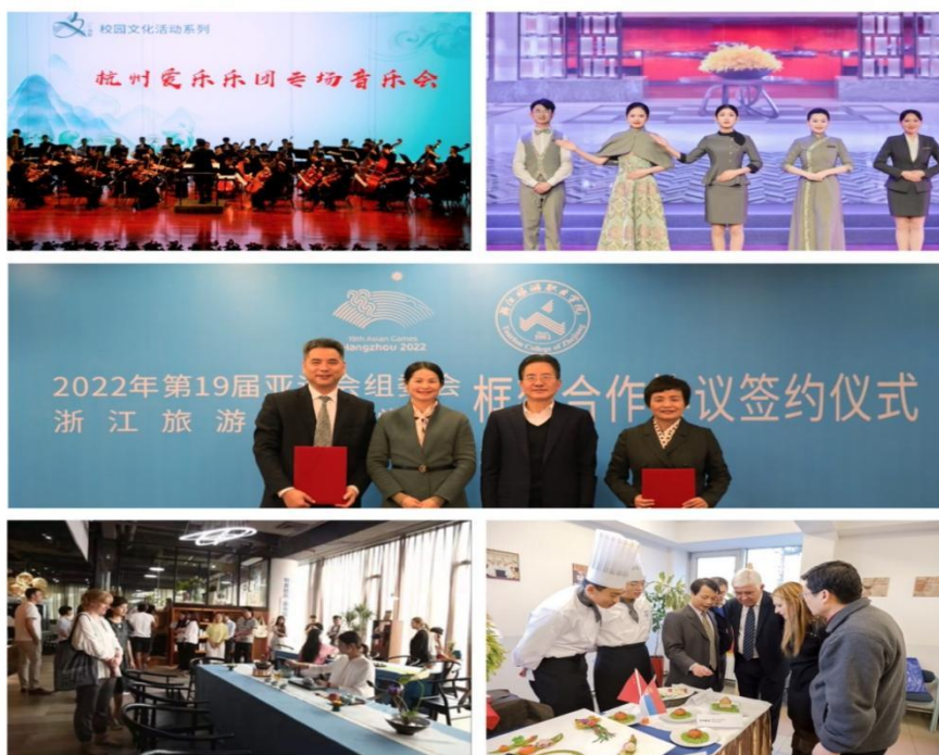
图 8 学生参与项目化教学