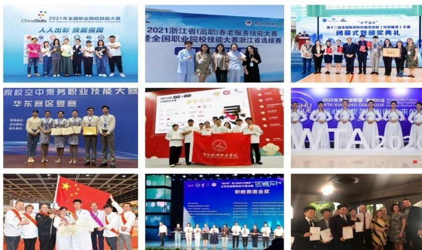
图 9 学生获得的国内外奖项

浙江旅游职业学院的实践探索取得了明显的成效。近五年学校毕业生就业率保持在 98%以上，其中 60%被国际品牌企业录用就业竞争力，起薪比普通专业毕业生高 15%，专业对口率、用人单位满意率等均位居全省高职院校前列；在校生在技能竞赛中获得国际级奖项 60 项、国家级奖项 313 项，每年赴境外高校、国际顶级旅游企业留学、实习的学生占毕业生总数的 10%以上。