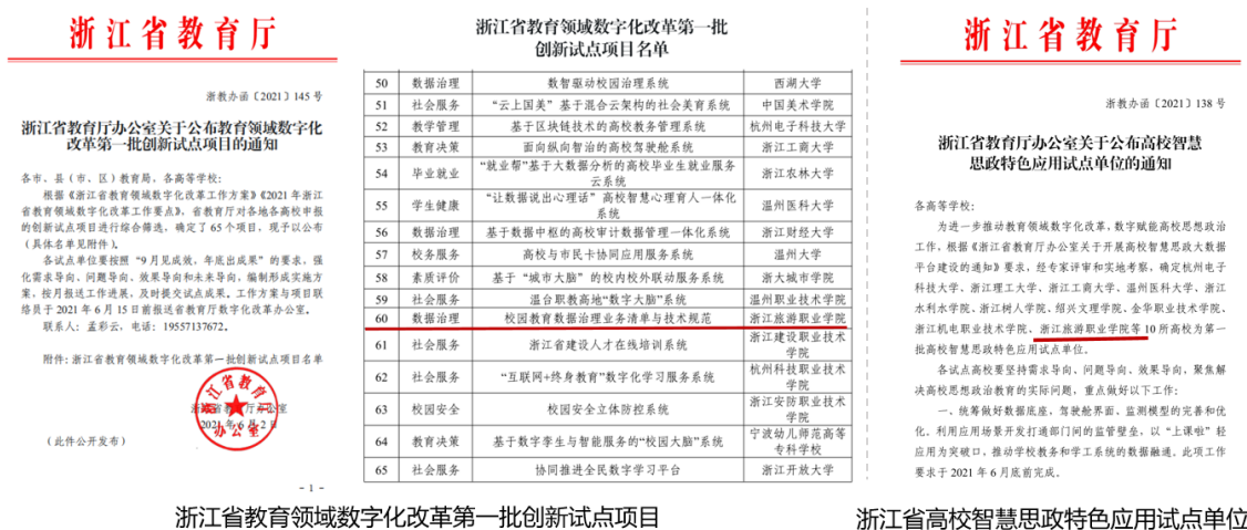
图1 浙江省教育厅公布教育领域数字化改革试点和高校智慧思政试点文件

2021 年度学校入选浙江省教育领域数字化改革第一批创新试点学校和浙江省高校智慧思政特色应用试点，是浙江省唯一同时入选两个教育领域数字化改革试点的高职院校。