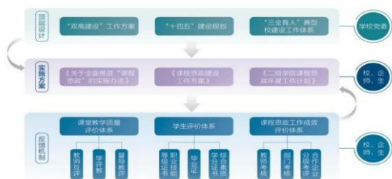
图 4 课程思政体系及实施方案