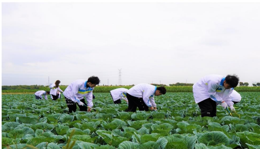
图 5 学生进行劳动教育