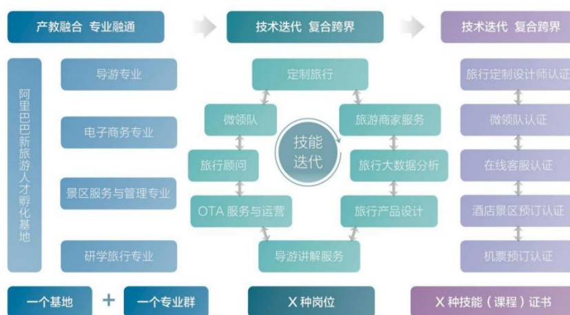
图 6 “多维立体、多岗递进”实践教学模式

融通校企： 依托浙江旅游职业教育集团、产业学院等平台， 构建书证融通体系 ，推进 18 项 1+X 证书试点，将职业岗位、职业技能与专业课程有机相融，开发相应的模块化课程、新形态教材和专业教学资源。 创新实践教学模式 ，深入校企合作、行业跨界融合创建“新旅游人才孵化基地”，在导游专业群创新“多维立体、多岗递进”的实践教学模式。