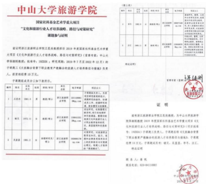
图 12 2019 年国家社科基金重大项目子项目立项名单